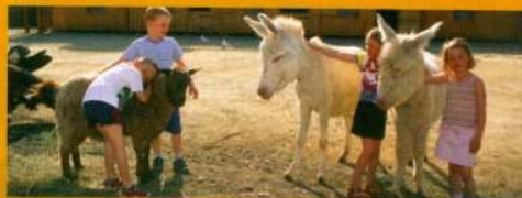
Zahlreiche liebenswerte Tiere und alte Handwerkskunst auf dem Meierhof

GEÖFFNET VON 14. 4. BIS 1. 11. 2006 TÄGL. 10-18 UHR, FÜHRUNGEN: 11, 14, 16 UHR