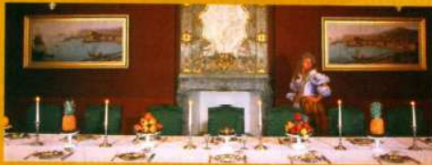
Die privaten Appartements von Prinz Eugen und Kaiserin Maria Theresia