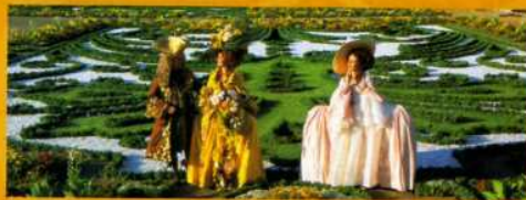
Faszinierende Pracht im barocken Terrassengarten